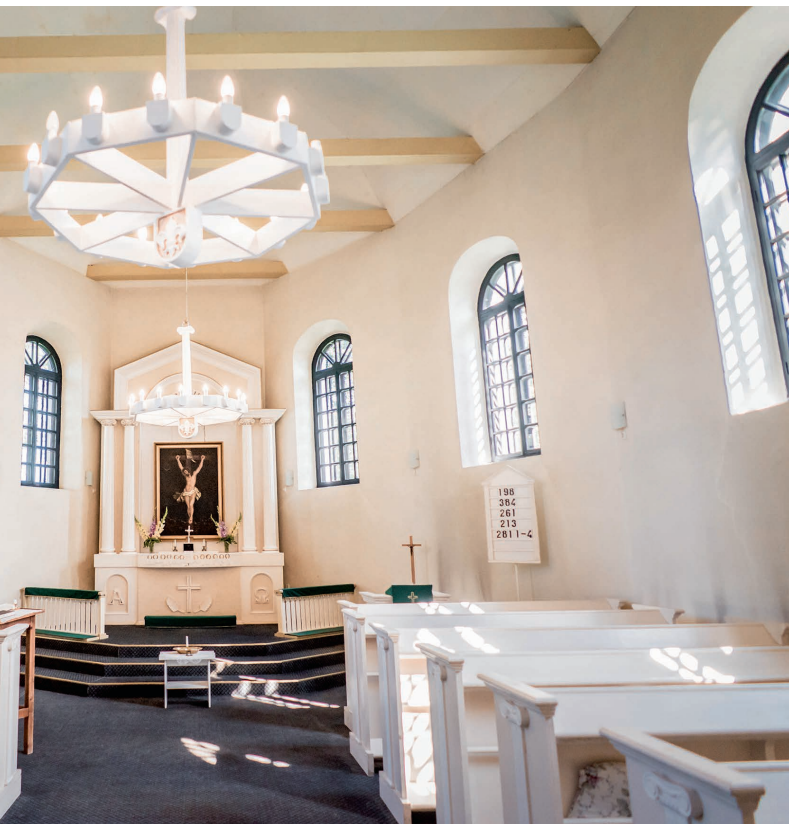
Baznīca vispirms aicina lūgt. Lidot var pēc tam.