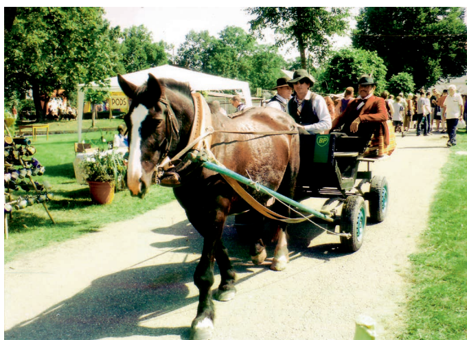
Svētkos tiek godināta pagātne. Korfa rati – par godu Ikara labvēlim.