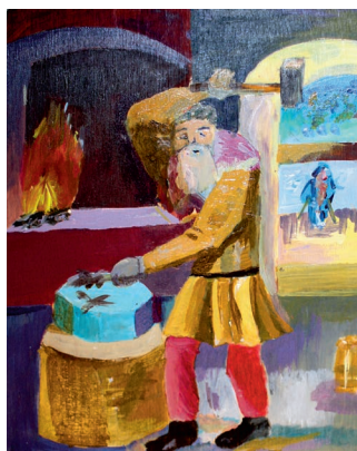
Top Ikara spārni. Konkursa zīmējums.