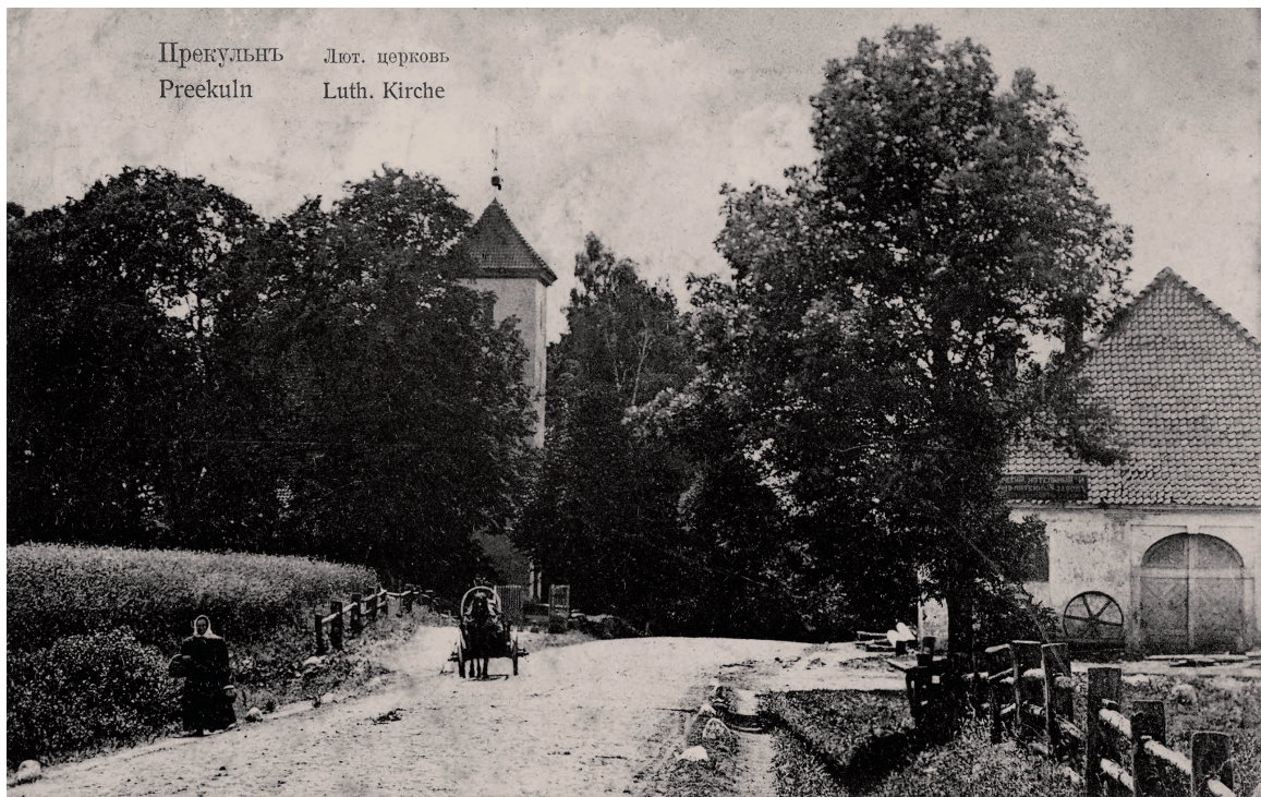
Priekule tāda, kāda nekad vairs nebūs. 20.gadsimta sākums.