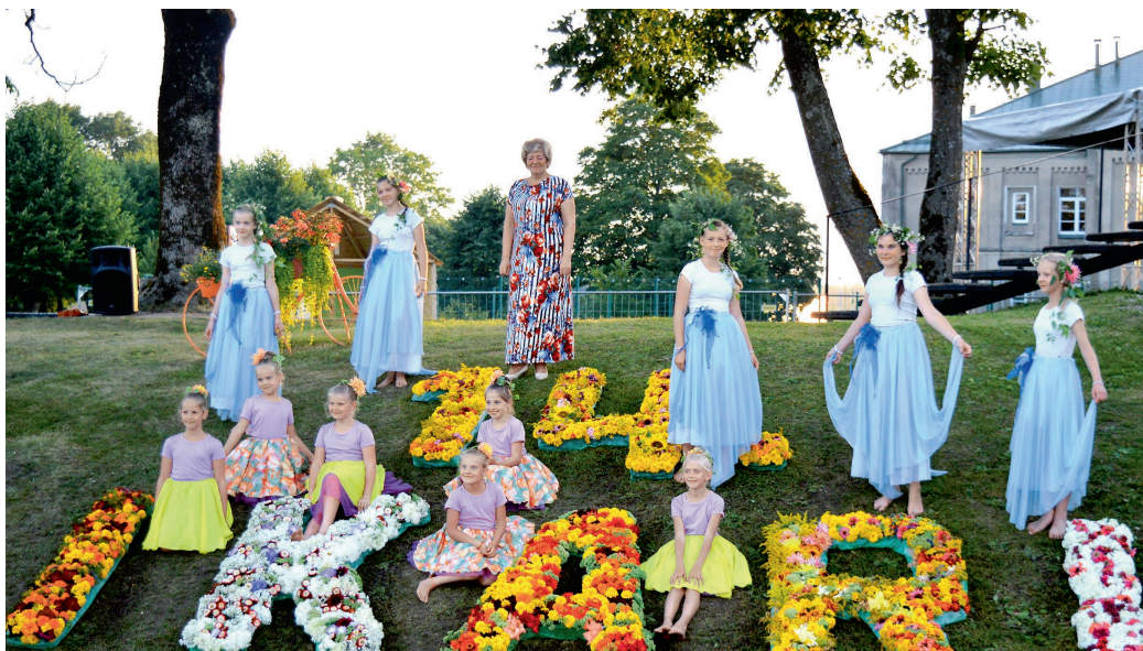
Ikara svētku uzraksts, kas veidots no pilsētnieku ziediem.

EKONOMIKA NEVAR NOTEIKT VISU, ARĪ GARAM IR JĀLIDO. RADOŠAJĀ ZIŅĀ IKARS IR ĻOTI PATEICĪGS TĒLS, VIŅŠ DOD VIELU FANTĀZIJAI.