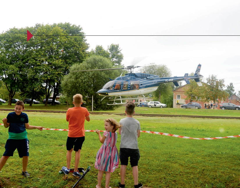
Ikara svētkos kaut kam ir jālido.