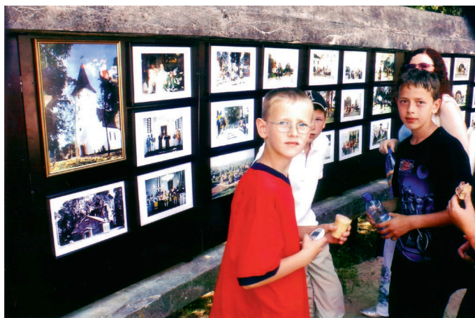
Jauniešus interesē, kāda viņu pilsēta ir bijusi kādreiz – vēl melnbaltās fotogrāfijās.

vēstures pētniecību un kultūru. Novadpētniecība bija spēcīga jau padomju periodā, bet tad, deviņdesmitajos, bija milzīgs "uh!" visādā ziņā – emocionāli, enerģētiski, intelektuāli. Katra interešu grupa deva savu ieguldījumu, neprasiņa, ko saņems preti," tā brīža ideālistisko