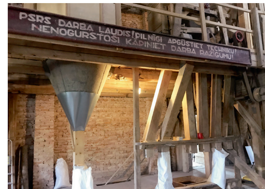
Orvila tēvs savulaik no melderis kļuvis par kultūras nama vadītāju un pašrocīgi gatavojis darbu stimulējošos padomju lozungus.