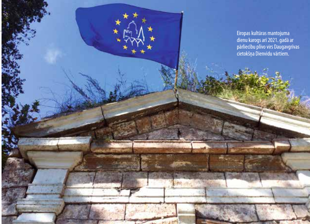
Eiropas kultūras mantojuma dienu karogs arī 2021. gadā ar pārliecību plīvo virs Daugavgrīvas cietokšņa Dienvidu vārtiem.