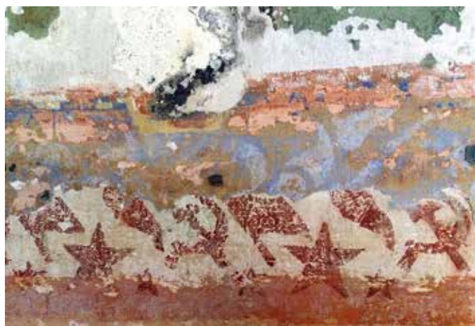
Rotājumi padomju "gaumē" dekorē arī daudz senāku būvju sienas.

"Pirms 30 gadiem te vēl bija padomju armija, kas aizgāja 1993. gadā. Padomju militārper- sonas pašrocīgi pavadīja māksli- nieku delegācijas, atzinīgi vērtē- ja pieminekļa statusa piešķirša- nu, nodeva pieklājīgi. Kādu laiku te bija Latvijas armija, bet nere- dzēja vajadzību pēc tik liela kompleksa – Aizsardzības minis- trijs izsludināja izsoli ar iespēju privatizēt. Tas bija ļoti divains