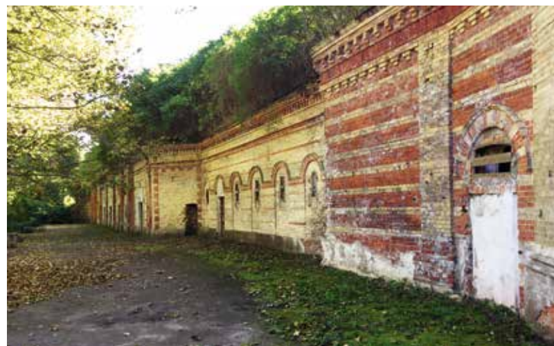
Laika zobs nesaudzē, bet vēriens ir grandiozs.