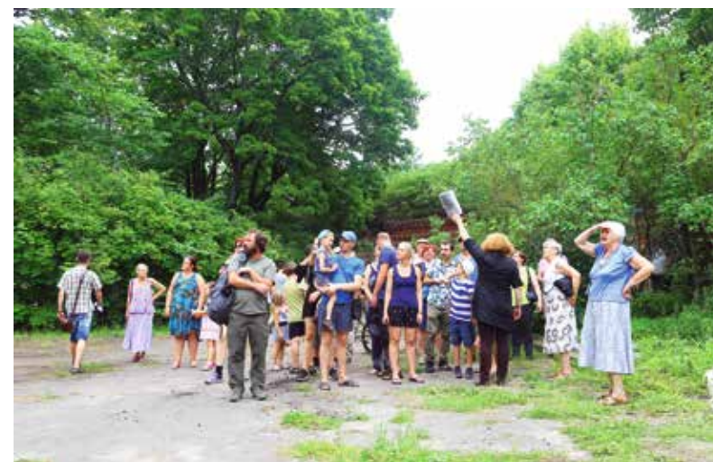
Interesenti Daugavgrīvas cietoksni iemīļojuši – te ir plašums, unikalitāte un vairāku gadsimtu kultūrlāņi.