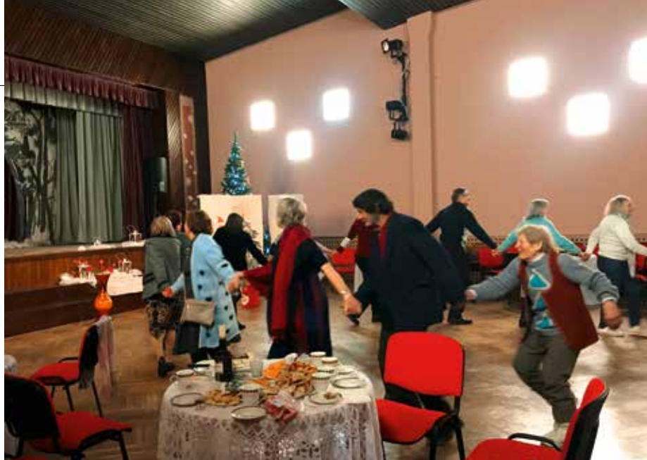
Vieta visiem. Kultūras nama ideja apvieno gan mākslu uz skatuves, gan satikšanās vietu ciema iedzīvotājiem.